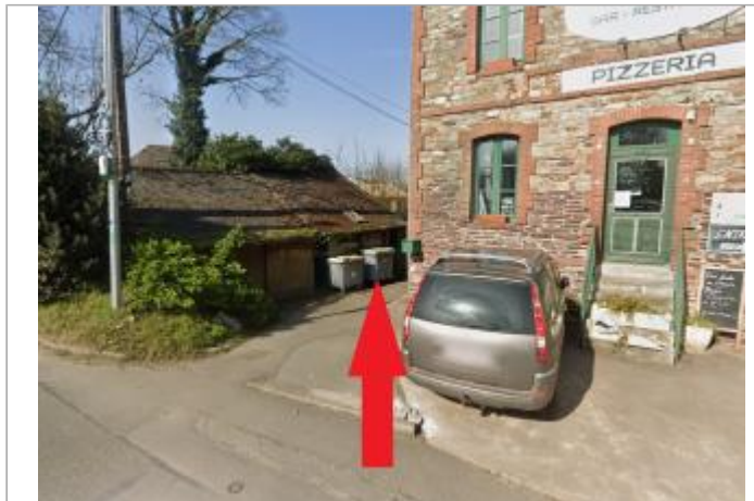
A l'arrière de la maison éclusière d'Apigné