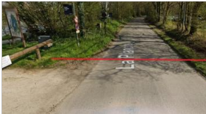
Apigné chemin rural n°72 près des étangs