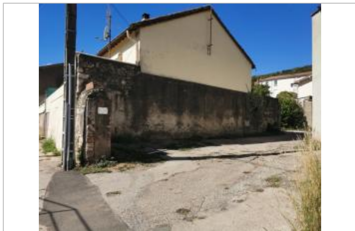
laisse au sol