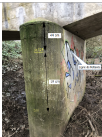
Marque de peinture sur la culée du pont

Altitude calculée de l'eau (en m) : 198.149 m