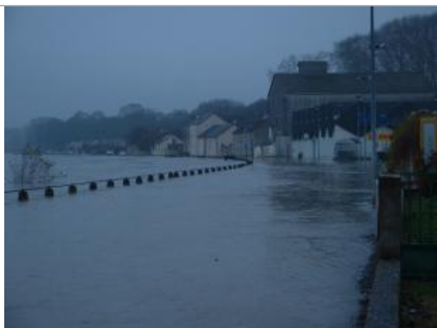
Vue de la photo en 2003 (4/12 09h47)

Altitude calculée de l'eau (en m) : 190.959 m