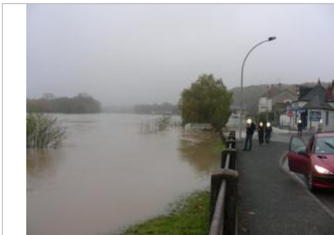
Vue de la photo en 2008

Altitude calculée de l'eau (en m) : 190.93 m