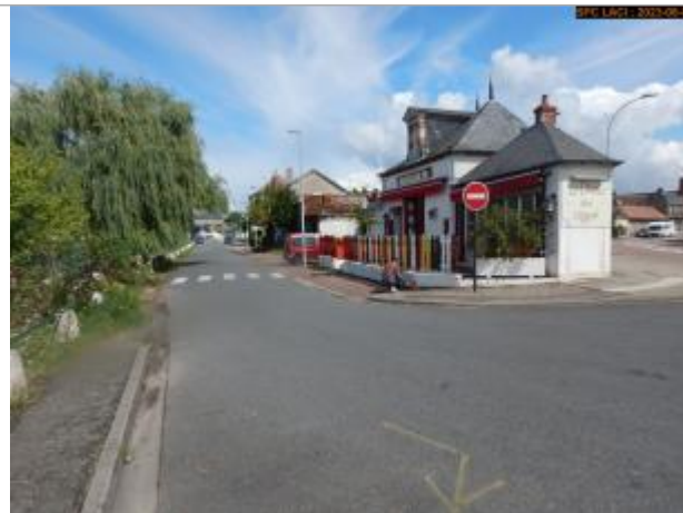
Vue du site en 2023 (crue 2008)