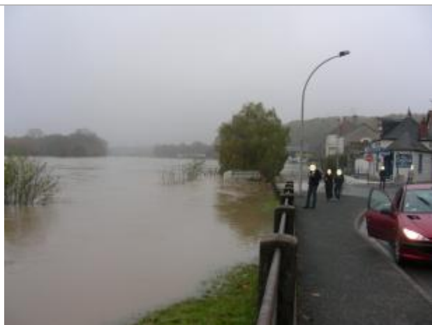
Vue de la photo en 2008

Altitude calculée de l'eau (en m) : 190.93 m