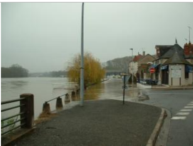
Vue de la photo en 2003 (4/12 11h53)

Altitude calculée de l'eau (en m) : 191 m