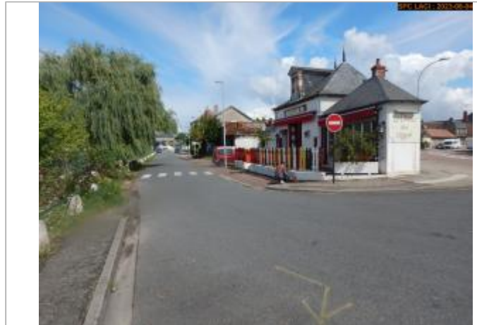
Vue du site en 2023 (crue 2008)