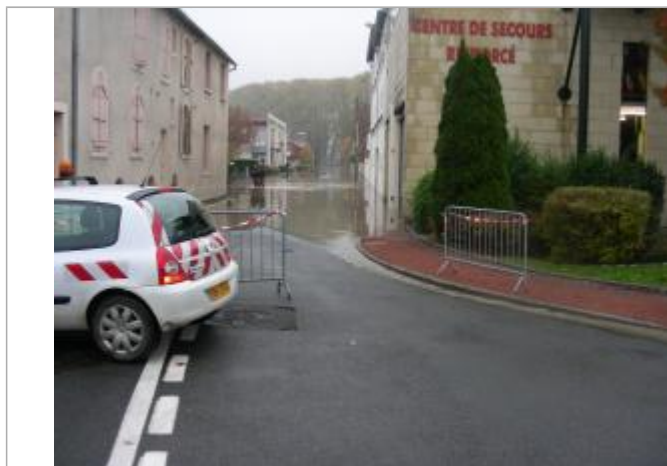
Vue de la photo en 2008

Altitude calculée de l'eau (en m) : 190.569