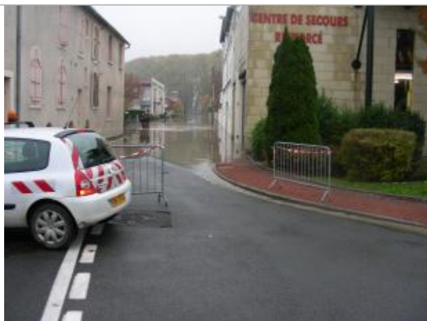
Vue de la photo en 2008

Altitude calculée de l'eau (en m) : 190.569