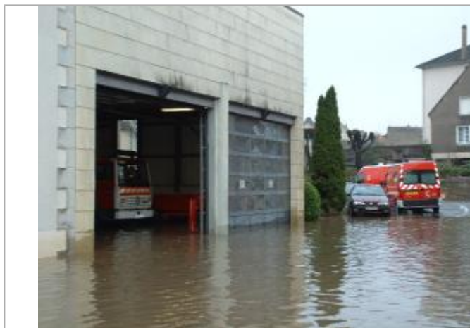
Vue de la photo en 2003

Altitude calculée de l'eau (en m) : 190.759