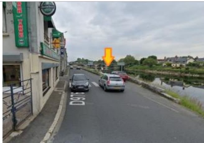
Vue du site en 2023 (Google Map)

Coordonnées WGS84 : X: 0.80723958 / Y: 47.35986360