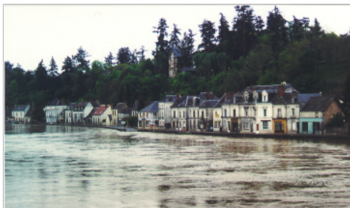
Vue de la photo en 2001

Type de repérage : Campagne de terrain post-inondation