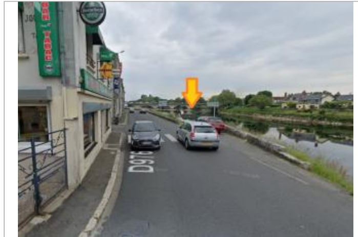
Vue du site en 2023