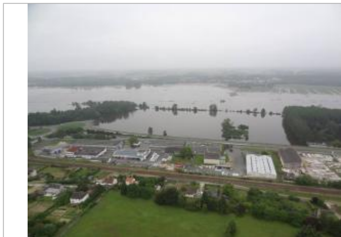
Vue de la photo en 2016 (Vue drone)