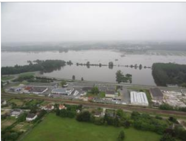
Vue de la photo en 2016 (Vue drone)

Altitude calculée de l'eau (en m) : 50.076 m