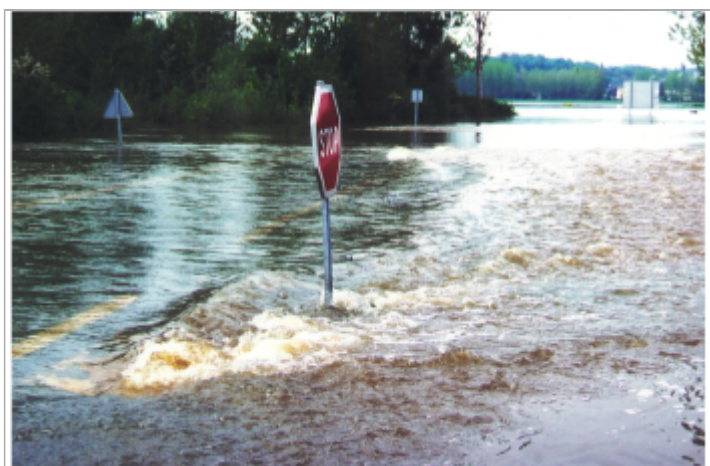
Vue de la photo en 2001

Altitude calculée de l'eau (en m) : 49.707