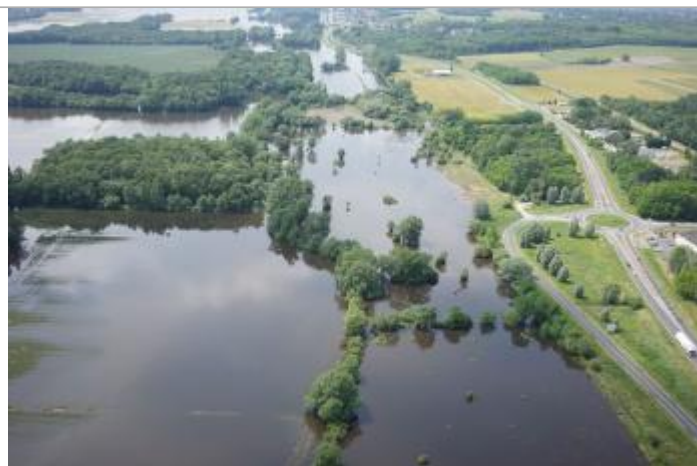
Vue de la photo en 2016

Altitude calculée de l'eau (en m) : 51.094