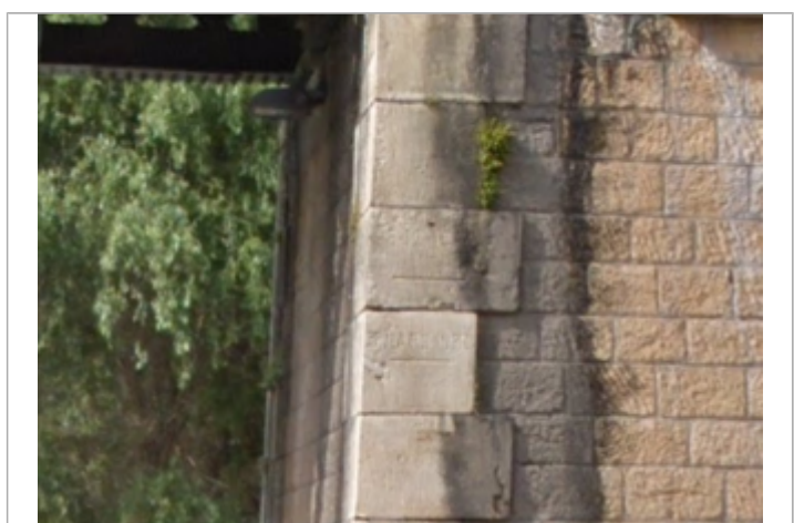
Vue du repère

MARQUE Maximum de l'inondation : Oui Visibilité : Oui État du repère : Moyen Pérennité : Longue