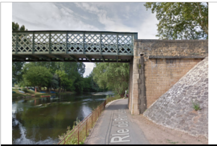
Vue du site

GÉOLOCALISATION Coordonnées WGS84 : X: 1.08833101 / Y: 45.01093200 Coordonnées RGF93 (Lambert 93) X: 549405.79 / Y: 6436456.17 Coordonnées RGF93 (ETRS89) : X: 1.088331 / Y: 45.010932 Code Hydro: P---0100 Rive de référence: Droite