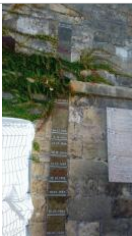
Vue du repère - auteur : Blanko36