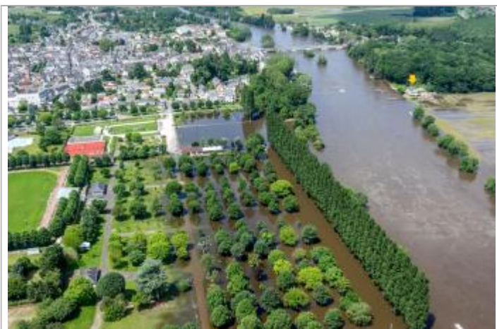
Vue de la photo en juin 2016 (après le pic de crue)