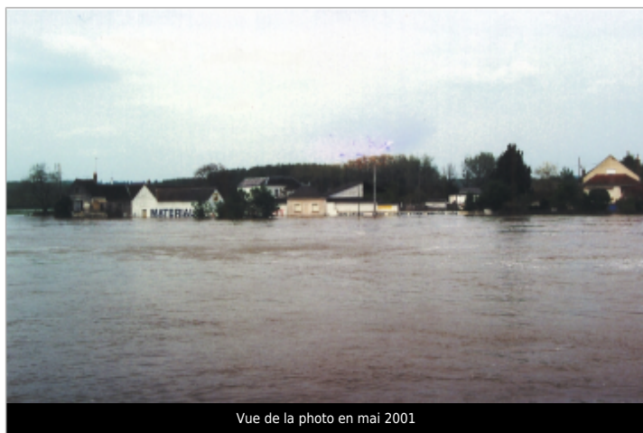
Vue de la photo en mai 2001