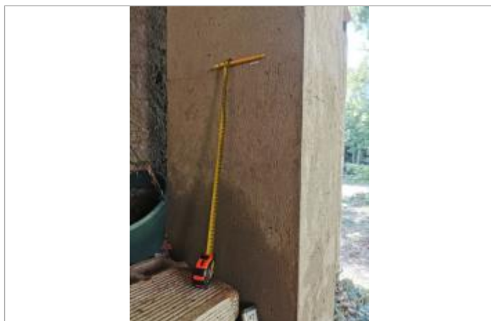
vue de la laisse sur le pillier de la Terrasse