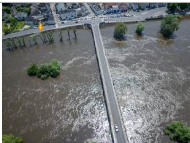
Vue de la photo en 2016