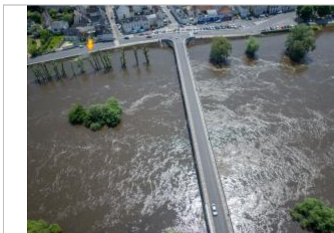
Vue de la photo en 2016