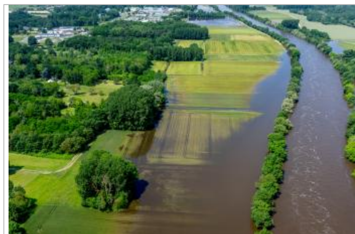
Vue de la photo en 2016

Altitude calculée de l'eau (en m) : 56.435