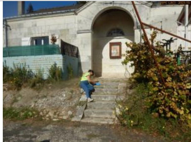
Vue du site en 2023 (Témoignage oral)