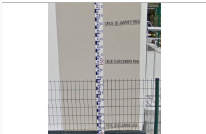
Vue du repère - source : Google Street View

Altitude calculée de l'eau (en m) : 9.45 m