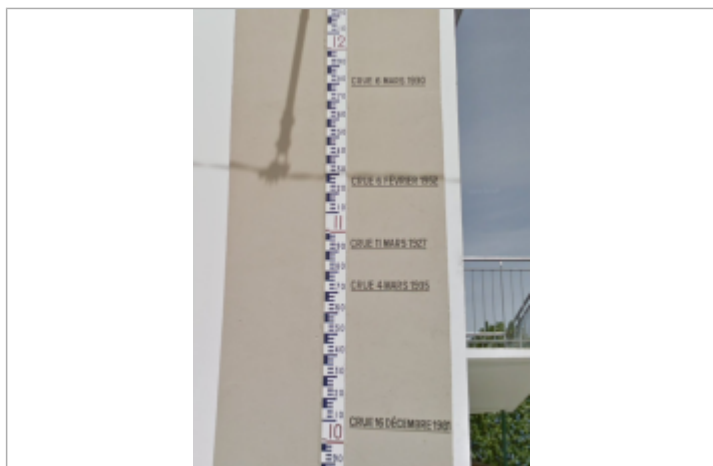
Vue du repère

Altitude calculée de l'eau (en m) : 11.18 m