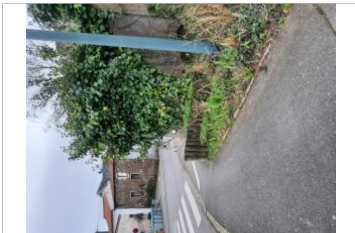
Vue sur la rue de la Croix Blanche