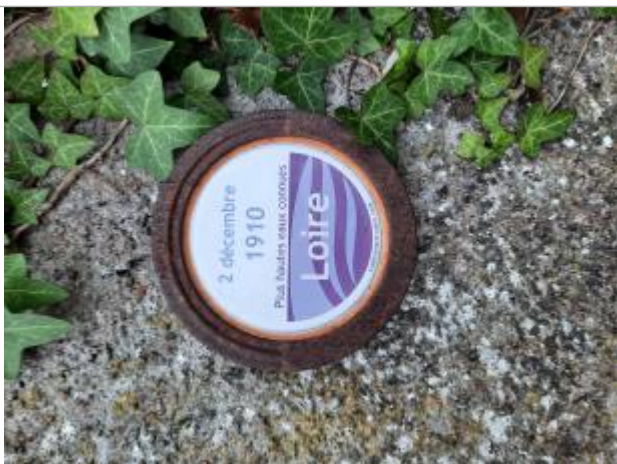
Repère de 1910

Altitude calculée de l'eau (en m) : 7.87 m