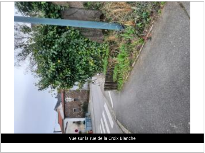
Vue sur la rue de la Croix Blanche