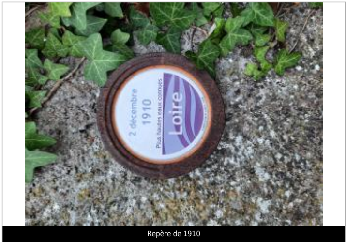
Repère de 1910