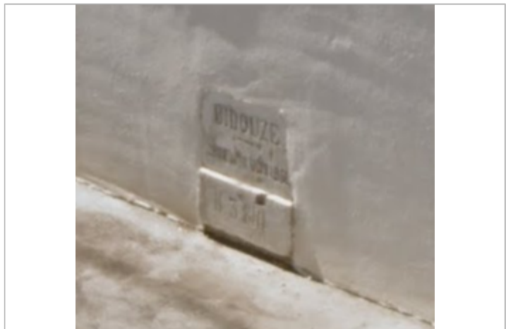
Vue du repère

MARQUE Texte : événement non identifié Maximum de l'inondation : Oui Visibilité : Oui État du repère : Moyen Pérennité : Longue