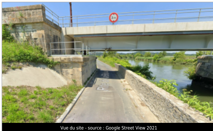
Vue du site

GÉOLOCALISATION Coordonnées WGS84 : X: -1.21013023 / Y: 43.52593640 Coordonnées RGF93 (Lambert 93) X: 359673.88 / Y: 6278726.07 Coordonnées RGF93 (ETRS89) : X: -1.2101302 / Y: 43.5259364 Code Hydro: Q8--0250 Rive de référence: Gauche