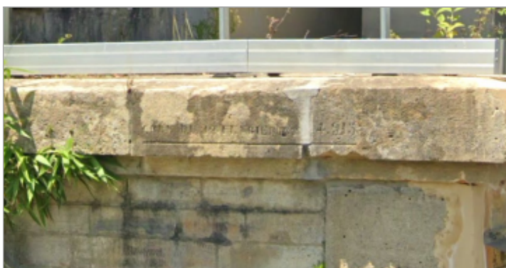
Vue du repère

MARQUE Maximum de l'inondation : Oui Visibilité : Oui État du repère : Moyen Pérennité : Longue