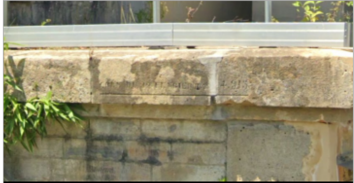
Vue du repère

MARQUE Maximum de l'inondation : Oui Visibilité : Oui État du repère : Moyen Pérennité : Longue