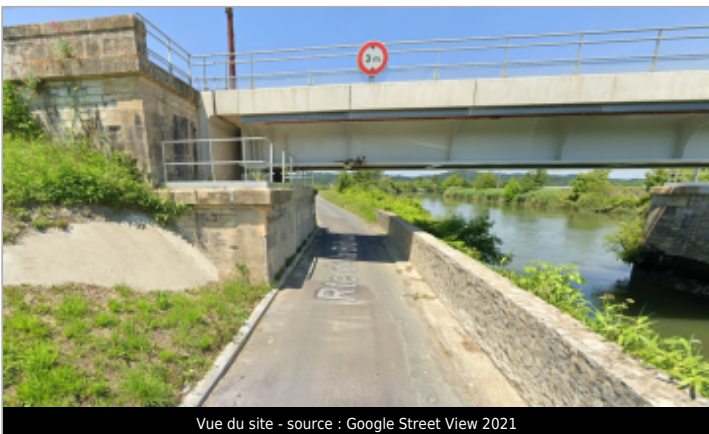
Vue du site - source : Google Street View 2021

GÉOLOCALISATION Coordonnées WGS84 : X: -1.21013023 / Y: 43.52593640 Coordonnées RGF93 (Lambert 93) X: 359673.88 / Y: 6278726.07 Coordonnées RGF93 (ETRS89) : X: -1.2101302 / Y: 43.5259364 Code Hydro: Q8--0250 Rive de référence: Gauche