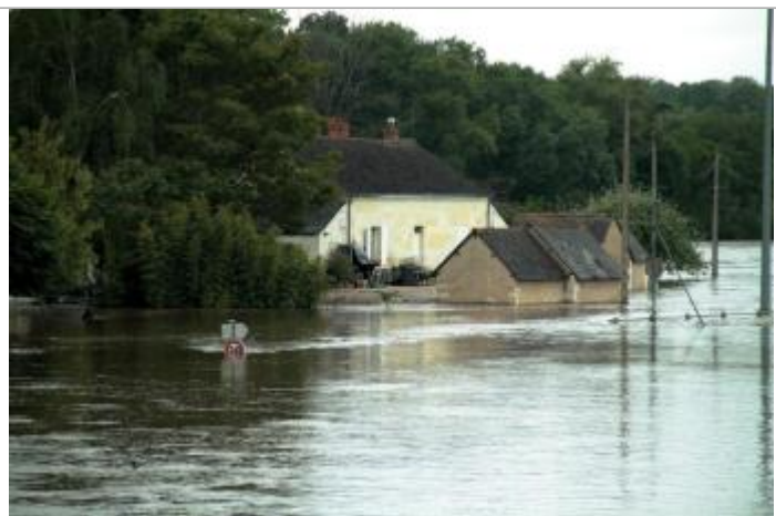
Vue de la photo en 2016

Altitude calculée de l'eau (en m) : 58.985 m