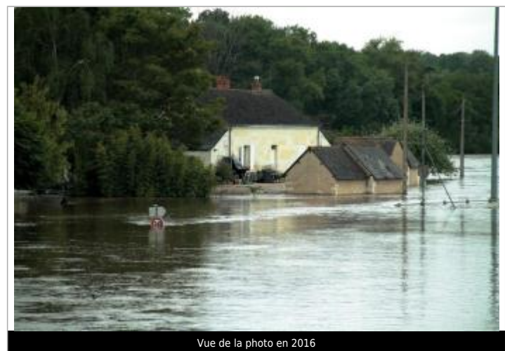
Vue de la photo en 2016

GÉNÉRAL Code : WEB_R_202402074914 Date de mise à jour : 30/03/2026 Auteur : SPC LACI