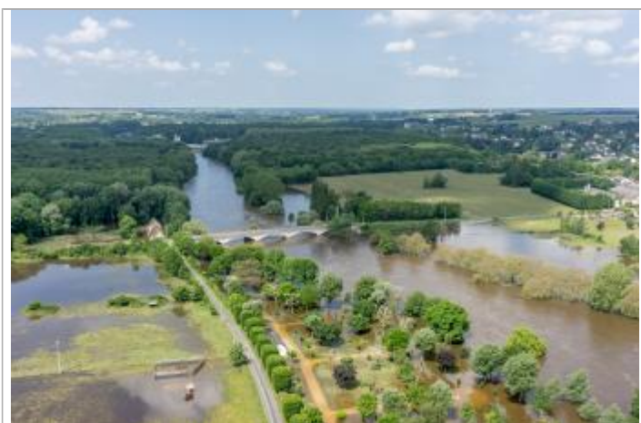
Vue de la photo en 2016

Altitude calculée de l'eau (en m) : 58.427 m