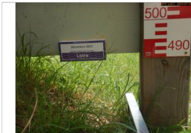
Vue du repère en 2023

Altitude calculée de l'eau (en m) : 169.508 m