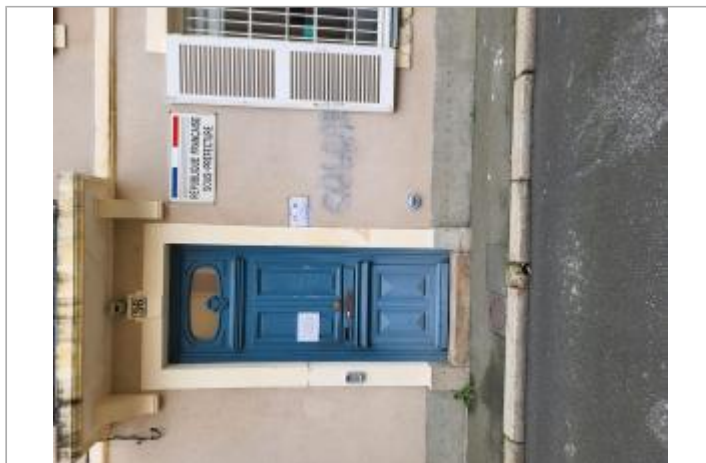
Sous-Préfecture de la Sarthe - La Flèche