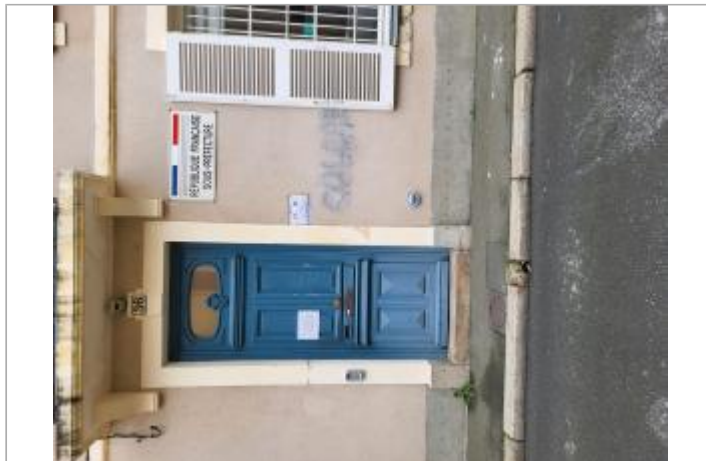
Sous-Préfecture de la Sarthe - La Flèche