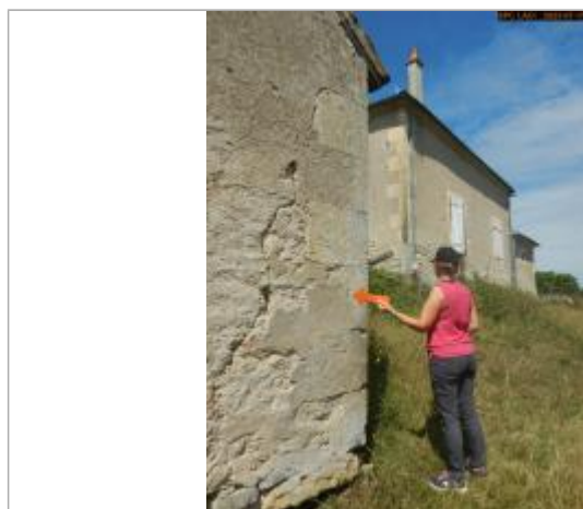
Vue du repère en 2023