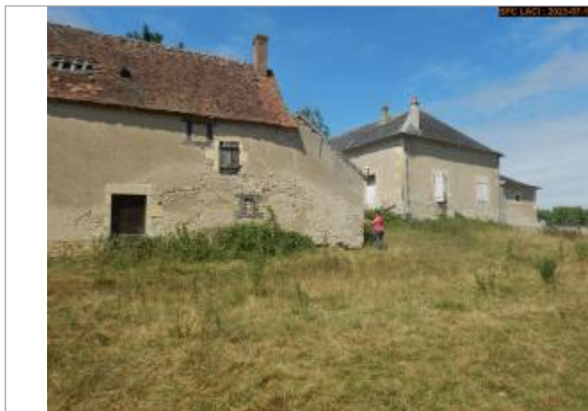
Vue du site en 2023