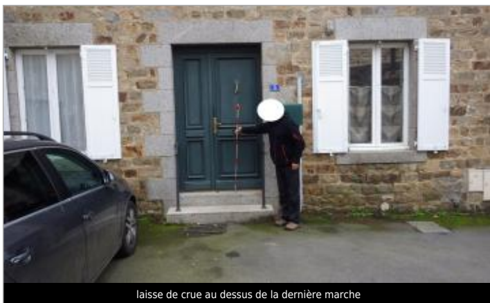
laisse de crue au dessus de la dernière marche