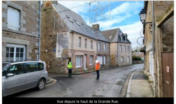
Vue depuis le haut de la Grande Rue.

Coordonnées WGS84 : X: -1.29507343 / Y: 48.61907960