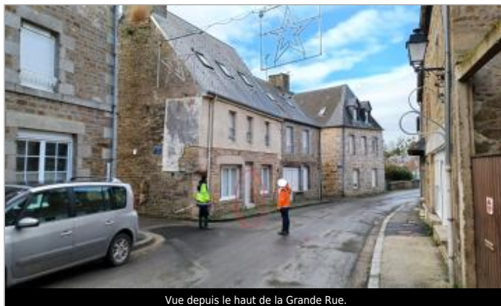
Vue depuis le haut de la Grande Rue.