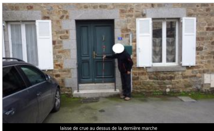
laisse de crue au dessus de la dernière marche