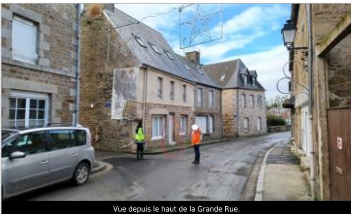
Vue depuis le haut de la Grande Rue.

GÉOLOCALISATION Coordonnées WGS84 : X: -1.29507343 / Y: 48.61907960 Coordonnées RGF93 (Lambert 93) X: 383574.02 / Y: 6844039.89 Coordonnées RGF93 (ETRS89) : X: -1.2950734 / Y: 48.6190796 Code Hydro: I9--0200 Rive de référence: Droite