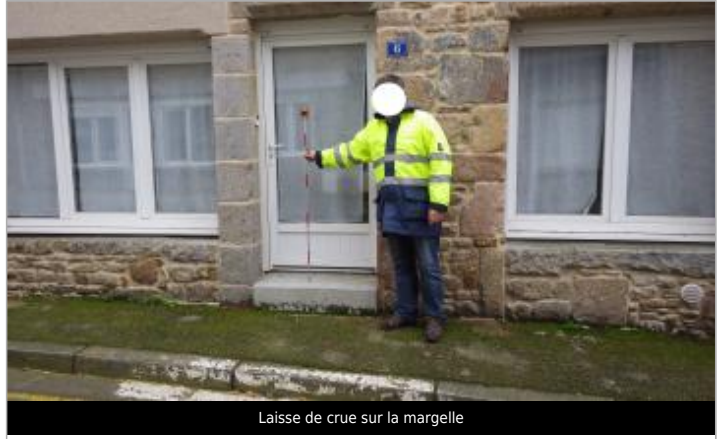
Laisse de crue sur la margelle

GÉNÉRAL Code : WEB_R_202402022451 Date de mise à jour : 12/11/2025 Auteur : SPC.SACN