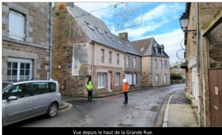
Vue depuis le haut de la Grande Rue.

Coordonnées WGS84 : X: -1.29507343 / Y: 48.61907960