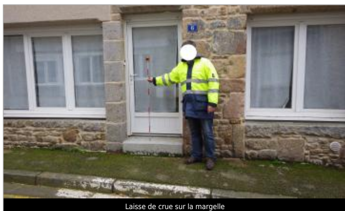
Laisse de crue sur la margelle