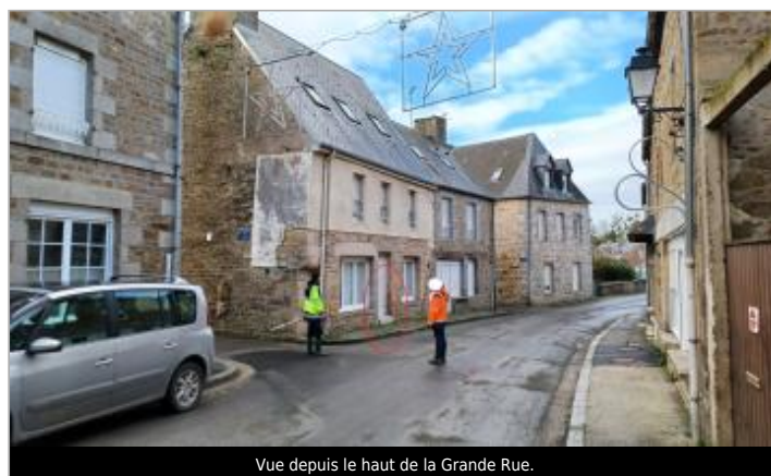
Vue depuis le haut de la Grande Rue.

GÉOLOCALISATION Coordonnées WGS84 : X: -1.29507343 / Y: 48.61907960 Coordonnées RGF93 (Lambert 93) X: 383574.02 / Y: 6844039.89 Coordonnées RGF93 (ETRS89) : X: -1.2950734 / Y: 48.6190796 Code Hydro: I9--0200 Rive de référence: Droite