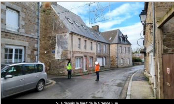
Vue depuis le haut de la Grande Rue.

GÉOLOCALISATION Coordonnées WGS84 : X: -1.29507343 / Y: 48.61907960 Coordonnées RGF93 (Lambert 93) X: 383574.02 / Y: 6844039.89 Coordonnées RGF93 (ETRS89) : X: -1.2950734 / Y: 48.6190796 Code Hydro: I9--0200 Rive de référence: Droite