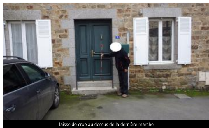
laisse de crue au dessus de la dernière marche

GÉNÉRAL Code : WEB_R_202402020812 Date de mise à jour : 12/11/2025 Auteur : SPC.SACN