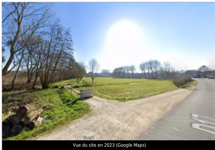
Vue du site en 2023 (Google Maps)

Coordonnées WGS84 : X: 0.73558414 / Y: 47.29150530