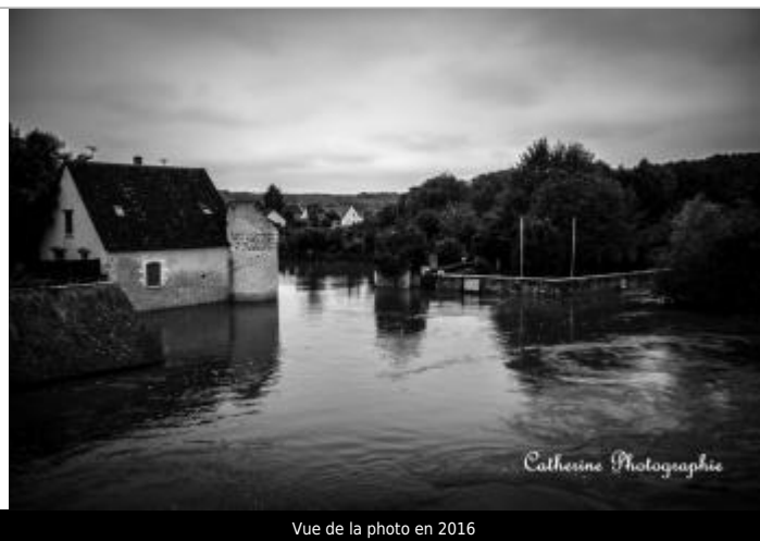
Vue de la photo en 2016

Altitude calculée de l'eau (en m) : 59.057 m