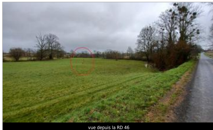
vue depuis la RD 46

Coordonnées WGS84 : X: -0.96962573 / Y: 48.59910720