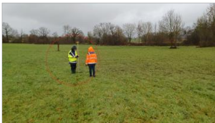
laisse de crue au sol.

Altitude calculée de l'eau (en m) : 75.55 m