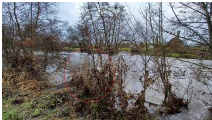
Laisse de crue sur l'arbuste