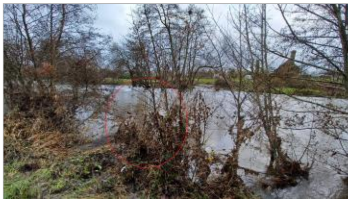
Laisse de crue sur l'arbuste