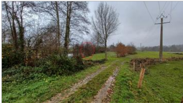
Vue depuis l'ouvrage hydraulique