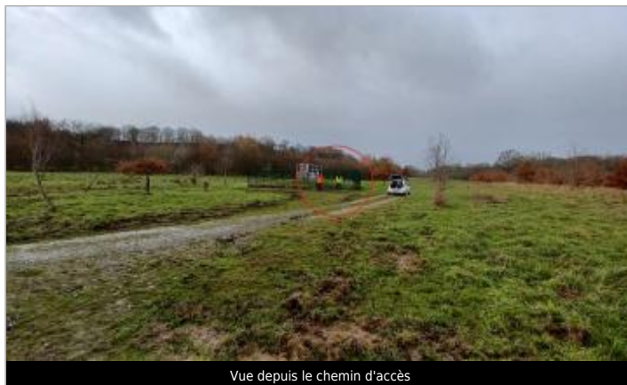
Vue depuis le chemin d'accès