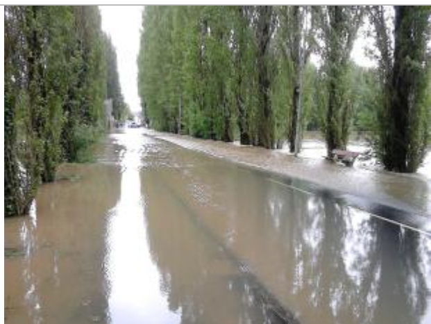
Vue de la photo en juin 2016

Altitude calculée de l'eau (en m) : 62.667