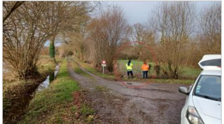
Vue depuis la rue des Prés.

Coordonnées WGS84 : X: -1.29751131 / Y: 48.61635740