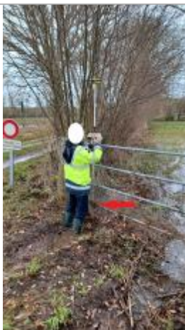
Laisse de crue à 21 cm/sol