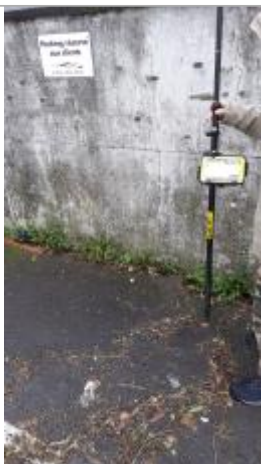
Laisse au sol

Altitude calculée de l'eau (en m) : 6.136