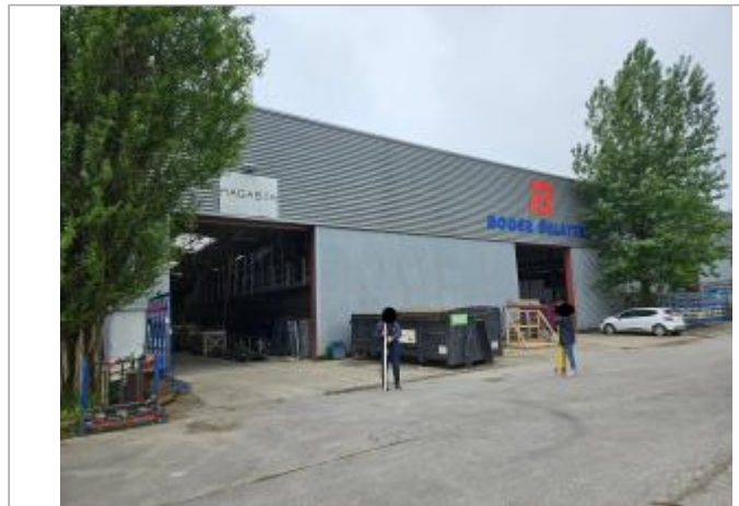
Entrée magasin Roger Delattre

Coordonnées WGS84 : X: 1.61232780 / Y: 50.69223950