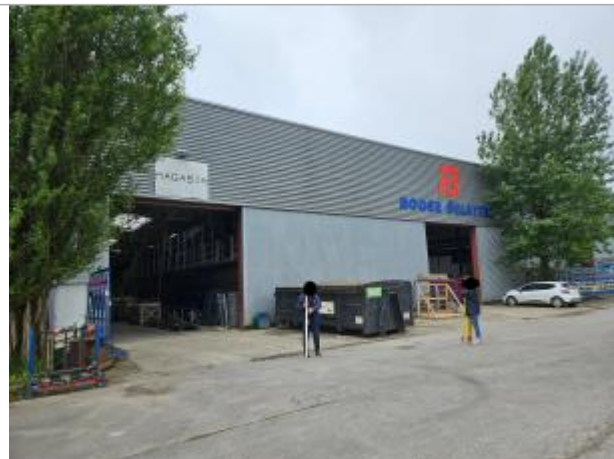
Entrée magasin Roger Delattre

Coordonnées WGS84 : X: 1.61232780 / Y: 50.69223950