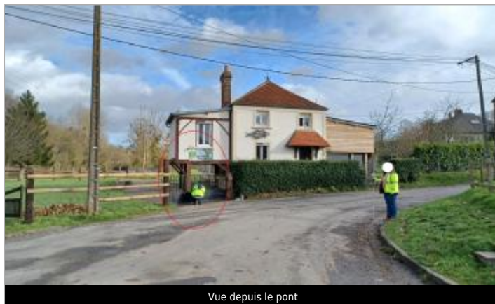
Vue depuis le pont