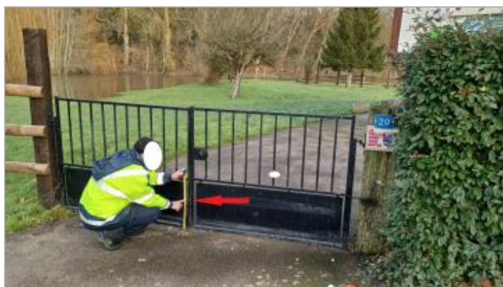
laisse de crue à 32 cm/sol.

Altitude calculée de l'eau (en m) : 146.69 m