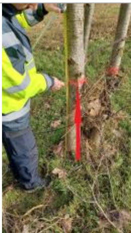
laisse de crue à 82 cm/sol.