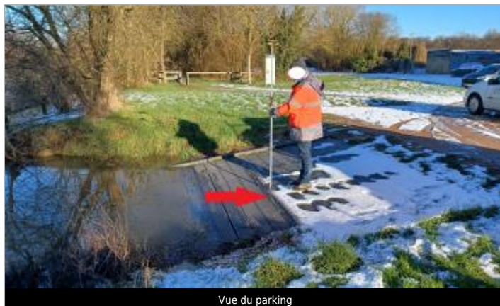
Vue du parking