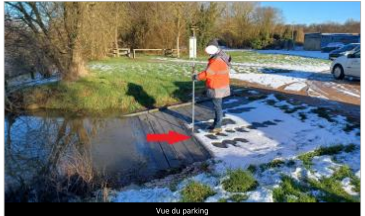
Vue du parking

Coordonnées WGS84 : X: -0.04037562 / Y: 48.73422940